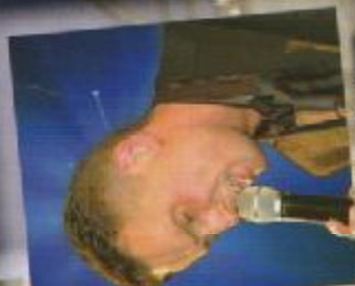
ALEX IL PRINCIPE