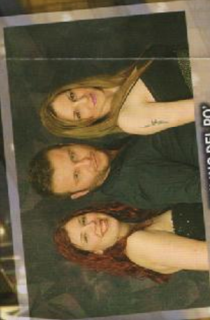
MULINO DEL PO'