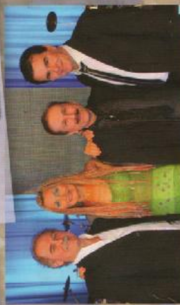
"ORCHESTRA CANTANDO BALLANDO"