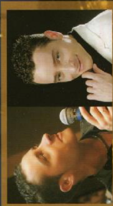
CON LA STRAORDINARIA PARTECIPAZIONE DELL'ORCHESTRA MATTEO TARANTINO

TUTTE LE SERE SI BALLERÀ CON LE ORCHESTRE